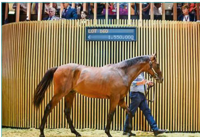
La Normandie terre du cheval, dimanche 20 août, à Deauville, lors des enchères des yearlings, le fils de Dubawi et de Glofa, élevé au haras de la Penelle (Calvados) a remporté la belle enchère à 1,55 million d'euros

Entre l'énergie nucléaire, les grandes installations de la pétrochimie et les projets des Energies Marines Renouvelables, la région normande est la locomotive de la production