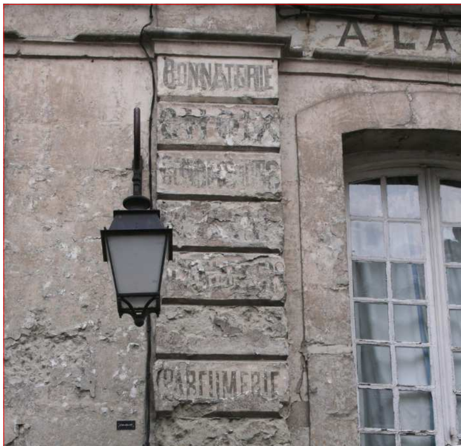
Les murs parlent : bonneterie, parfumerie... Cet immeuble de commerce est désormais une habitation

Energie positive. Etienne Cool est très satisfait des performances de sa ville qui a remporté un AMI TEPCV (Territoire à énergie positive pour la croissance verte) auquel ont participé 9 candidats normands. Il s'agit d'un programme expérimental lancé en 2015 sur l'égalité des territoires par Ségolène Royal ,