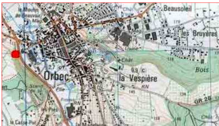
Orbec dans sa cavité et La Vespière sur le plateau.

Les grosses sociétés comme FEVI international leader européen des ventilateurs industriels, Loxos spécialiste des meubles pour crèches et hôpitaux, SNWM équipementier pour l'automobile se sont installées à quelques kilomètres de là, en haut de la côte, sur le plateau qui domine la vallée dans la commune de La Vespière. Ici la population a littéralement explosé, passant sur la même période de 402 à 1.227 habitants. A La Vespière, les usines, les supermarchés et l'habitat