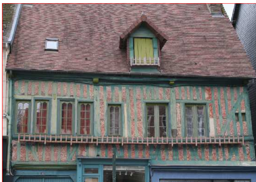
Exemple d'encorbellement, le premier étage avance sur le rez-de-chaussée et souvent l'appartement du dessus n'est accessible que par le magasin. Une plaque indique la date de 1616