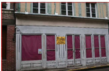
Même si leur nombre s'est réduit les boutiques à vendre sont encore bien visibles pour le badaud

pavillonnaire, à Orbec les boutiques et les lieux historiques.