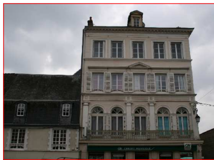
Un des immeubles du 18e siècle est occupé par le Crédit Agricole

Un exemple de ce dessaisissement des responsabilités : une boutique en ville a été consacrée à la présentation de la rénovation d'Orbec, elle est fermée vitres voilées. Le maire explique que la mission de la stagiaire qui s'en occupait est terminée, il ne sait ni quand une autre viendra, ni si il y en aura une autre, cela dépend de l'EPCI. Le budget de la ville de 4,55 millions euros, avec une baisse de 40% de la dotation de l'Etat, elle est passée de 435.000 euros à 263000 euros. Une situation qui permet difficile-